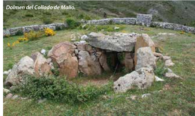
Dolmen del Collado de Mallo.

Monumento megalítico datado hacia 3.500 – 2.300 a de C. Sepulcro de corredor restaurado. Acceso andando por camino señalizado, a 2 kms. de Trevijano (señales blancas y verdes).