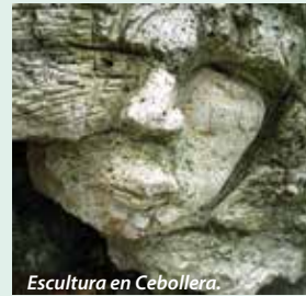
Escultura en Cebollera.

En su origen, en el año 2000, hubo 8 esculturas de land art realizadas por artistas nacionales e internacionales con materiales naturales, distribuidas en el entorno de la Ermita de la Virgen de Lomos de Orios, por el Sendero de la Virgen y el Sendero del Achichuelo. Con el tiempo, muchas esculturas se han integrado en la naturaleza y ahora solo se pueden ver aquellas esculpidas en piedra Consultar en el Centro del Parque Natural, en Villoslada: 941 46 82 16