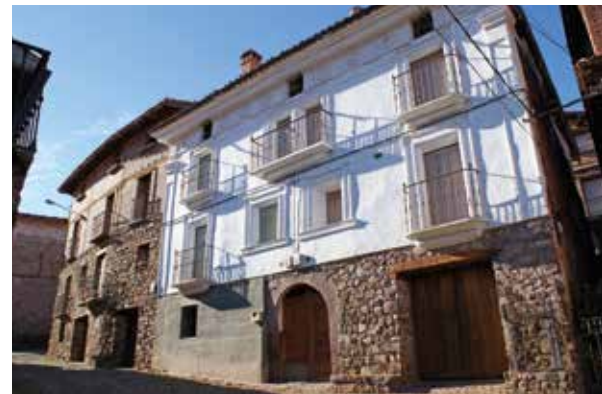
Casa en Laguna de Cameros.