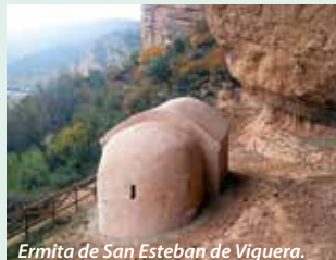
Ermita de San Esteban de Viguera.

Pequeña iglesia bajo un peñasco y con acceso andando (20-30 minutos) por un sendero de fuerte pendiente desde la carretera N-111, km. 305. Hay que pedir las llaves en Venta la Paula (941 44 20 46), situada a pie de la carretera. En el interior hay pinturas que recuerdan a las miniaturas de los manuscritos de los monjes, en cuatro colores: rojo, ocre, blanco y negro. Información: Ayto. de Viguera – 941 44 20 78