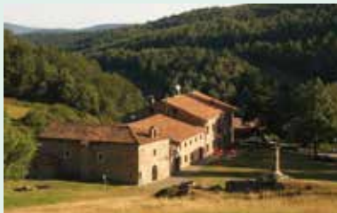
Venta de Piqueras.

La exposición se compone de tres módulos con textos, material foto-gráfico y objetos de uso tradicional de los pastores, así como de maquetas y reproducción de ambientes. Actividades y Visitas educativas para escolares. Abierto todo el año. Información: 941 09 08 07 y 941 46 82 16