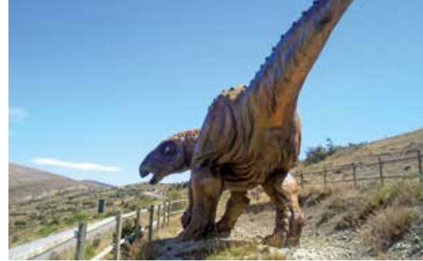
Yacimiento de La Pellejera en Hornillos de Cameros.

Exposición sobre la emigración riojana a América a finales del s. XIX y comienzos del s. XX. Se trata de viajar en el tiempo a través de recreaciones de diferentes momentos clave del movimiento migratorio: el origen, el viaje, el destino y el regreso. Entrada gratuita. Información: 941 46 04 73