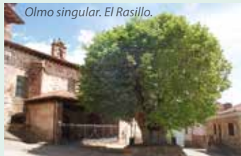
Olmo singular. El Rasillo.