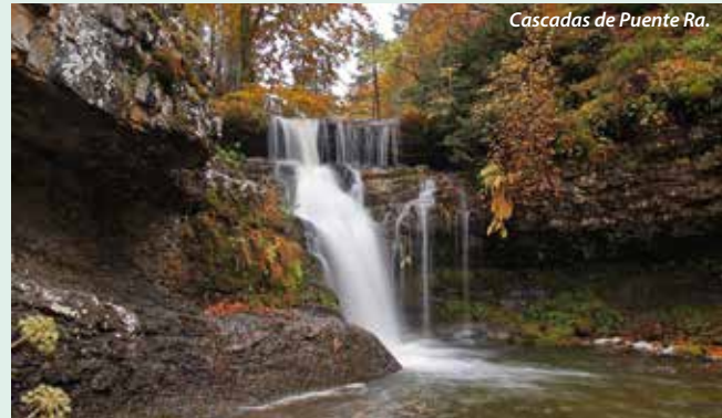
Cascadas de Puente Ra.

Interesante colección de útiles, herramientas, mobiliario, vivienda y la escuela tradicional, en recuerdo de la vida y costumbres de las aldeas. Destaca una estela funeraria romana del siglo I d. C. El horno comunal de San Andrés, restaurado, está situado junto a la casa del Museo Etnográfico. Información: 941 46 80 25 y 676 05 34 05