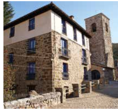
Cabezón de Cameros.

Casa solariega y escudo en alabastro del Solar de Tejada. Acceso por camino desde Cabezón o por el sendero de gran recorrido GR-93, desde Laguna y Muro en Cameros.