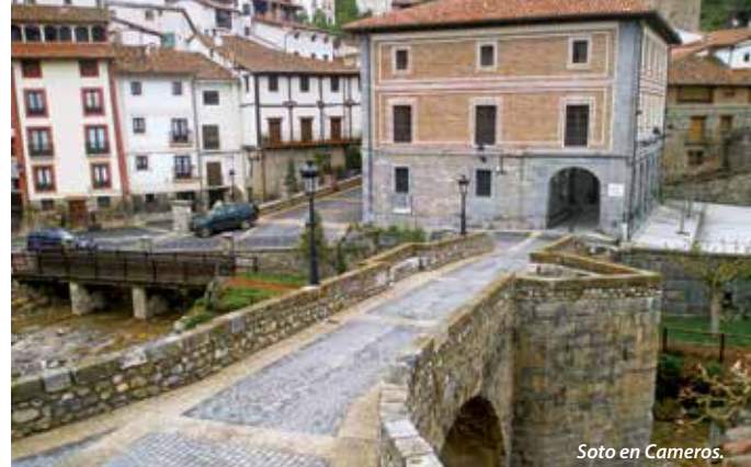
Soto en Cameros.