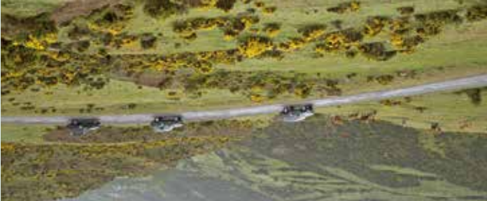
Ruta en coche por el paisaje del Camero Viejo.

La carretera del Puerto de Peña Hincada, 1.412 m., desde Orriçosa de Cameros y por Brieve de Cameros (LR-232), nos permite llegar al Monasterio de Valvanera (32 kms.), y luego acceder a la ruta de monasterios por Anguiano y el cruce de Bocabilla a San Millán de la Cogolla . Además, de camino a Valvanera, en Brieve de Cameros se puede visitar el Rancho de Esquilio y Trashumancia: www.ranchoesquilio.org