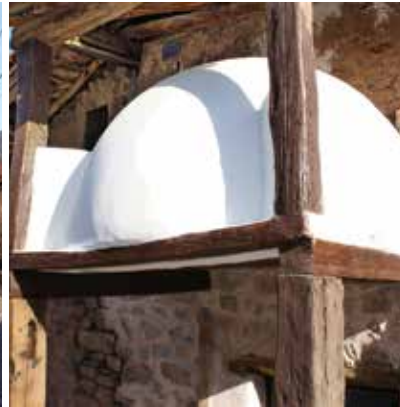
Horno de pan en Rabanera.