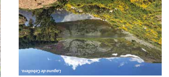
Laguna de Cebollera.

Una ruta de 20 kms. comunidad amos valles por la carretera LR-245 entre Almarza de Cameros y Jalón de Cameros, por el puerto de La Raza (1.379 m.), y desde la aldea de San Andrés de Cameros por el puerto de Sancho Leza (1.401 m.) a Laguna de Cameros (14 kms.). La Laguna Negra de Soria, por el Puerto de Santa Inés (1.592 m.), desde Villoslada de Cameros (LR-333), negro de Cameros (LR-333) y al Puerto de Santa Inés, 1.758 m., (SO-832 y SO-831) y descender en dirección a Vinuesa. La Laguna Negra de Soria, por el Puerto de Santa Inés (1.592 m.), desde Villoslada de Cameros (LR-333), negro de Cameros (LR-333) y al Puerto de Santa Inés, 1.758 m., (SO-832 y SO-831) y descender en dirección a Vinuesa. Desde Villoslada de Cameros, por Monte- negro de Cameros (LR-333) y al Puerto de Santa Inés, 1.758 m., (SO-832 y SO-831) y descender en dirección a Vinuesa. Se puede visitar los pueblos de Las Viniegras , Laguna de Urbión (se accede a pie a través de un sendero de 15 km.), y embalse de Mansilla , por la carretera del Puerto de Montenegro, 1.592 m., desde Villoslada de Cameros (LR-333).