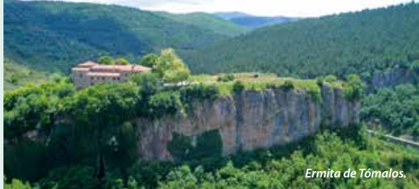
Ermita de Tómalos.

Situada en un lugar paisajístico de singular belleza, sobre un peñasco que se asoma al río Iregua, un acantilado rocoso, con acceso en coche desde la carretera N-111 en el km. 293. De los siglos XVII y XVIII, de estilos Reyes Católicos y barroco. Cristo de Arnao de Bruselas y pinturas murales. Teléfono: 941 46 01 08