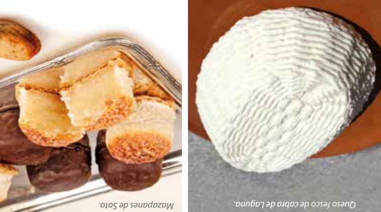
Mazapanes de Soto.