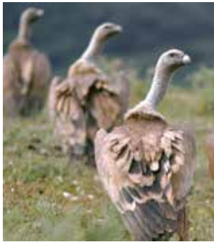
Buitres en el Camero Viejo.

A la salida de Soto hacia San Román se puede visitar una nevera. Acceso señalizado a 200 metros, junto al cementerio y la Ermita del Campo.