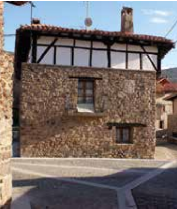
Casa en Rabanera de Cameros.

Casa solariega con escudo. Acceso por la carretera a Hornillos y desvío por pista forestal, a 3 kms. de San Román.