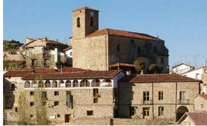
San Román de Cameros.

Camino señalizado de 9,5 kms., desde Jalón, por el yacimiento de huellas de Muro en Cameros y el hayedo de Torre en Cameros.