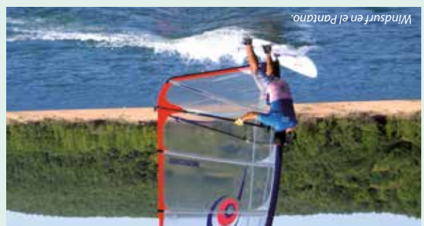
Windsurf en el Pantano.

En la Sierra de Cameros también se pueden realizar actividades deportivas de montaña, raquetas de nieve, esquí de travesía, kayak, rafting, bicicleta de montaña, barranquismo, etc... (Consultar con empresas de turismo activo)