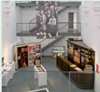
Centro de la emigración riojana de Torrecilla.

Exposición sobre la figura de Práxedes Mateo Sagasta, nacido en Torrecilla en Cameros en 1825 y una de las personalidades más sobresalientes de la vida social y política de España en el siglo XIX. Visitas: Ayuntamiento de Torrecilla: 941 26 23 90.